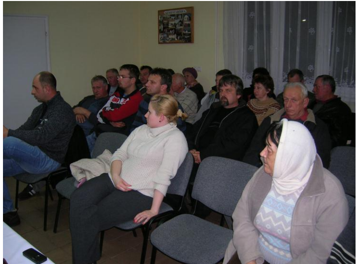
1. kép Közmeghallgatás

A lakossági fórumon a várható csatorna-közmű beruházásról is tájékozódhattak az érdeklődők. Önkormányzatunk csatorna