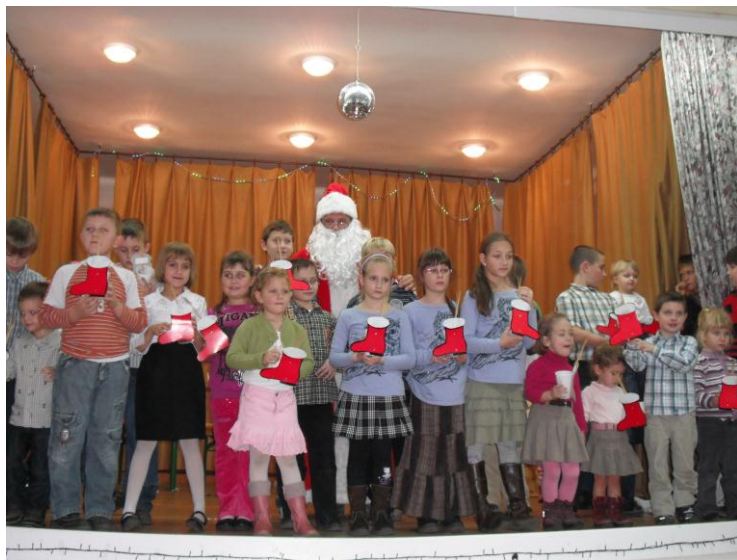
4. kép Mikulás a Művelődési házban

A polgármester asszony köszöntő szavai után a Cservék citerazenekar fiatal tagjai kápráztatták el a közönséget hangszeres tudásukkal, majd a kemestaródfai fiatalok verscsokra csalt mosolyt a szülők és