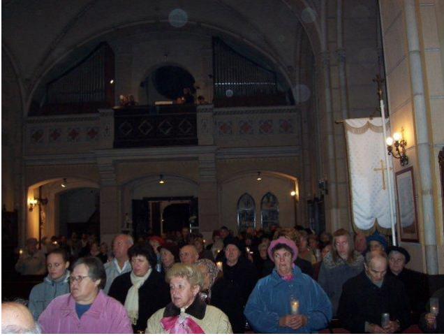
7. kép Hívek